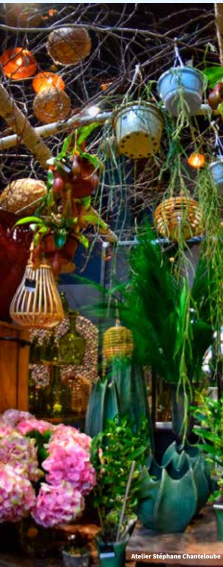
Atelier Stéphane Chanteloube