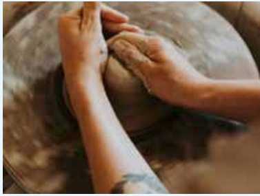
Atelier Les petites Carottes