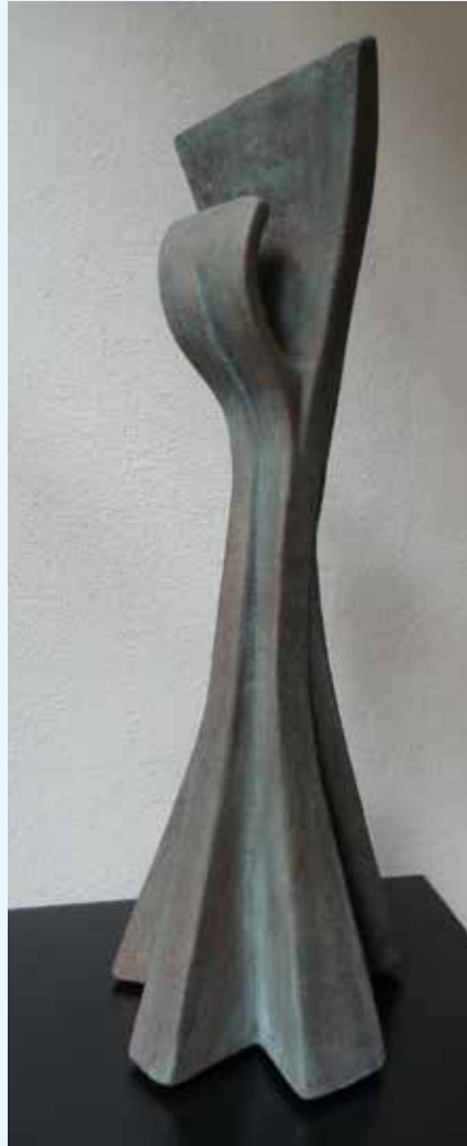
Atelier Terre d'Orange