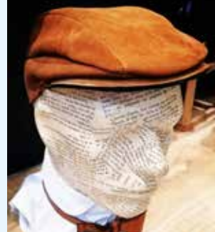
Le Cabinet des Créateurs