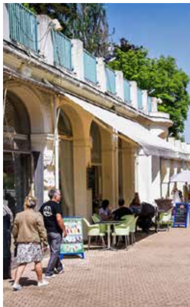
Parc thermal - Châtel-Guyon.