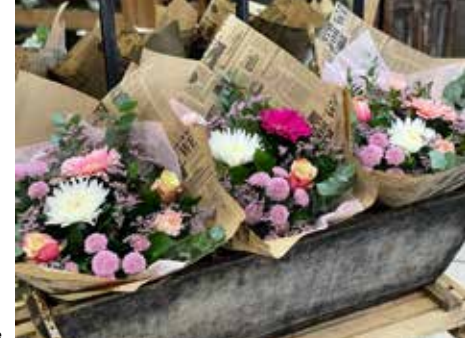
Atelier floral d'Aurélie