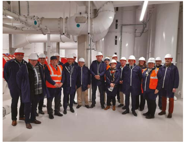
Les élus de RLV ont découvert le nouveau moulin « NZA 1000 » en avril dernier.

Le chantier du nouveau moulin à blé de Limagrain Ingrédients touche à sa fin en Limagne, entre les communes d'Ennezat et de Saint-Ignat. Ce site innovant, appelé « NZA 1000 » accueillera une quarantaine de salariés, et représente un investissement de 24 millions d'euros. Il a bénéficié de l'accompagnement de RLV, mais également du soutien financier de l'Etat dans le cadre du Plan de Relance, de l'Europe et de la Région Auvergne-Rhône-Alpes. Inauguration prévue en septembre prochain.