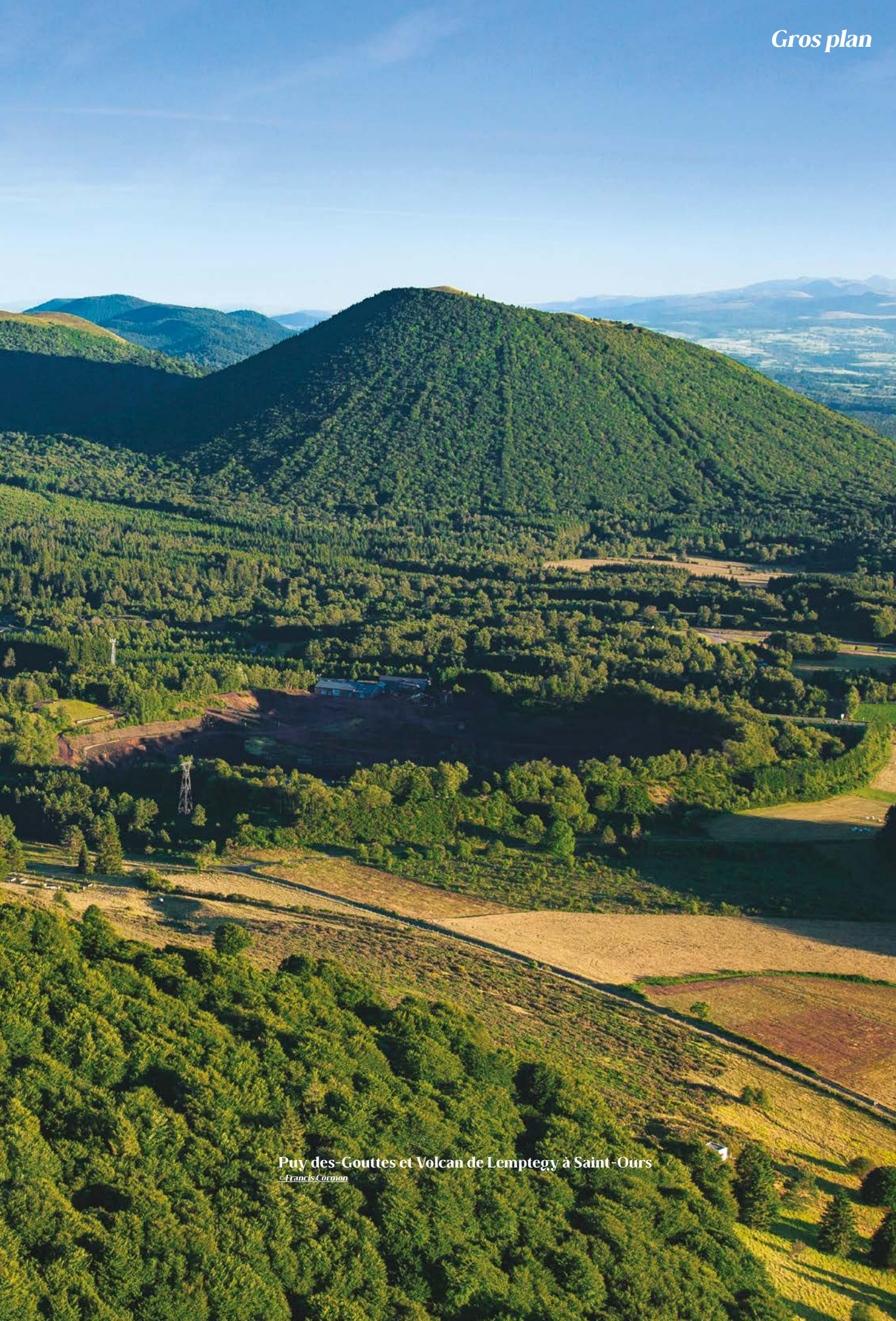
Puy des-Gouttes et Volcan de Lemptegy à Saint-Ours