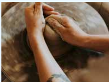
Atelier Les petites Carottes