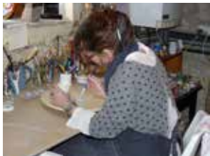
Atelier Juste pour toi