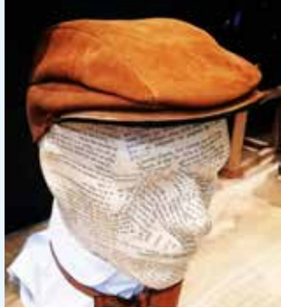
Le Cabinet des Créateurs