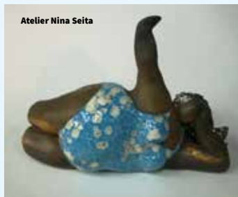
Atelier Nina Seita

Vendredi 14 h à 19 h Samedi et dimanche 10 h à 19 h