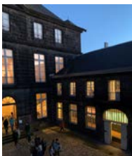
Musée Mandet © P. Bally / Musée de Bonn, Litvagner et Wolansky