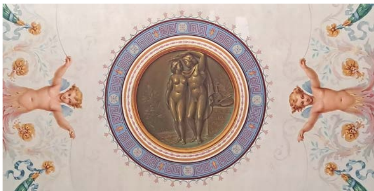
Cabine et site en ligne, Musée Mandet