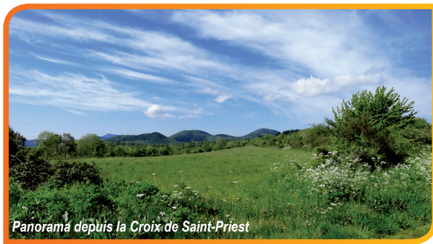
Panoramá depuis la Croix de Saint-Priest