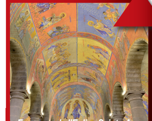
Fresques de l'Eglise Sainte-Anne

Théâtre, le Casino et les Anciens Thermes et continuer tout droit le long du bois jusqu'au chemin. Emprunter le chemin du Veix jusqu'au carrefour avec la route de Riom. Prendre à gauche et rejoindre l'office de tourisme.