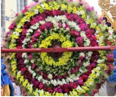
Roue de fleurs de la Saint-Amable 2018, Riom