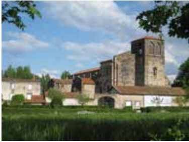
Bâtiments de l'abbaye, Mozac