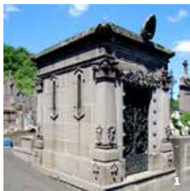
1. Monument funéraire, Riom