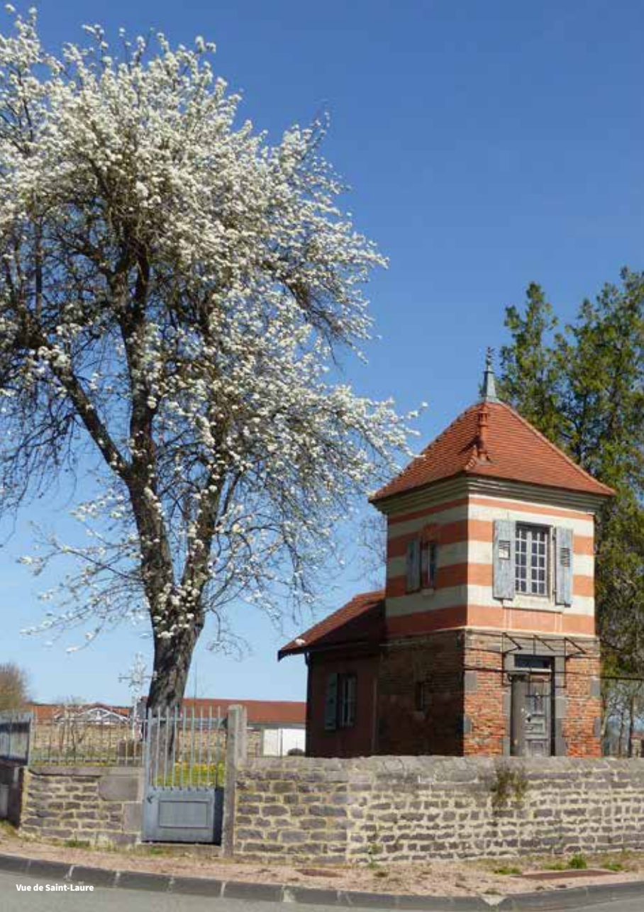
Vue de Saint-Laure